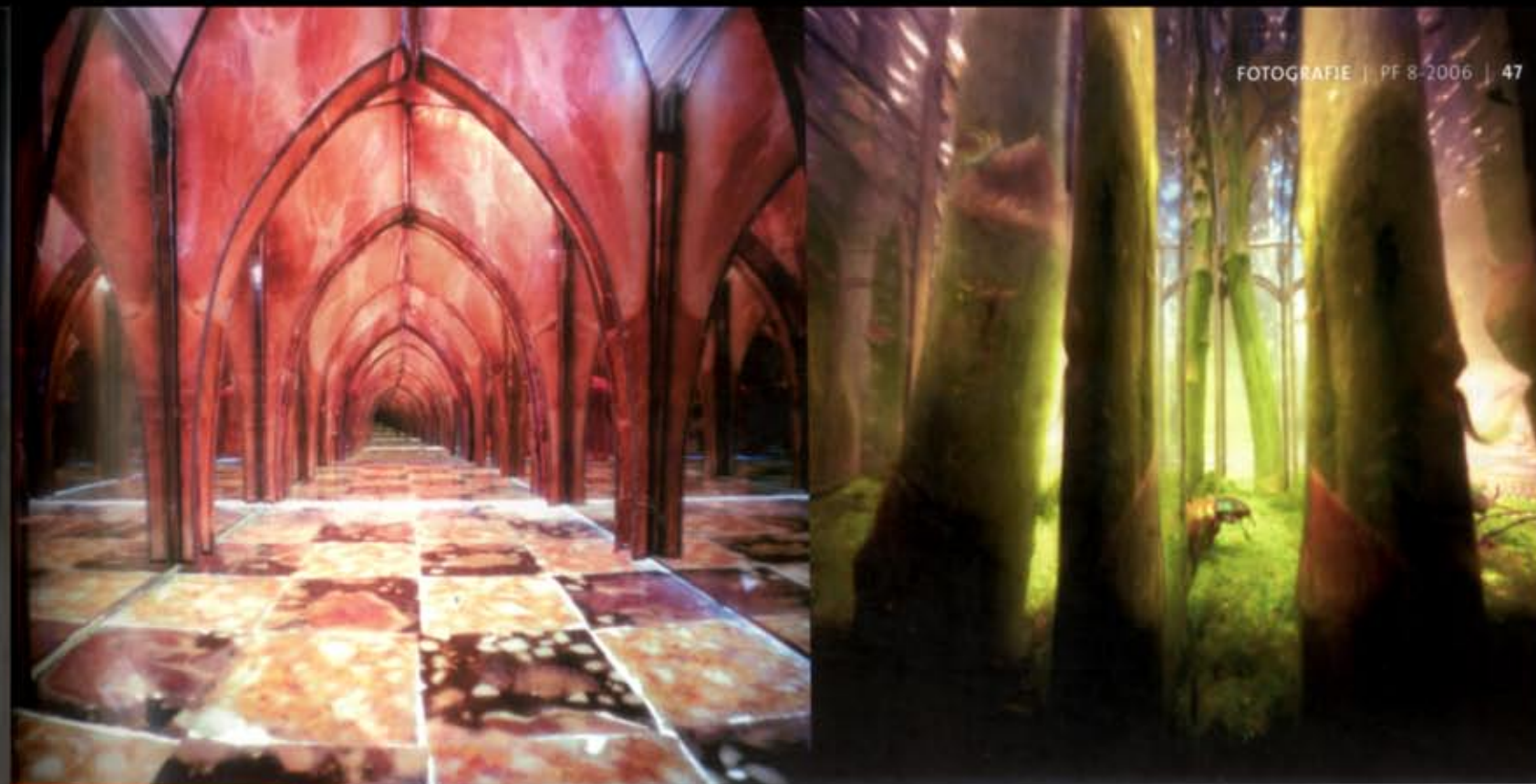
Linkerpagina en boven © Bethany de Forest Onder: De opnamen van Bethany komen tot stand in een maquette